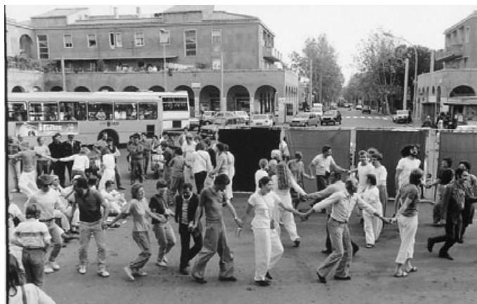
Manifestazione per la chiusura dei Manicomi a Primavalle (1977)

Come la ASL ha riportato i pazienti psichiatrici al S.Maria della Pietà. Una storia triste di istituzioni senza valori e memoria. Pazienti che passano da un Dipartimento all'altro, avvocati che ripropongono lo stigma della pericolosità sociale